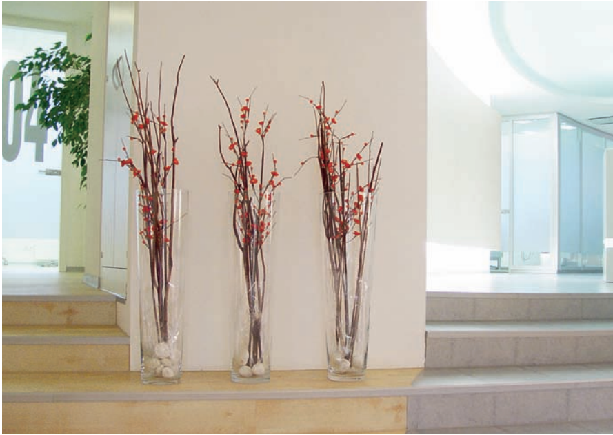
Weiß als dominante Farbe, aber mit gezielt eingesetzten Farbakzenten

Farbtöne Meerblau, das ebenso aus den CI-Farben der Praxis rührt, sowie Silber, das für die moderne High-Tech-Ausstattung steht und das auf der Homepage sowie der Geschäftsausstattung durch ein Logo in Form eines durch Gitterlinie dargestellten Zahnmodells aufgegriffen wird. Um nicht zu kühl zu wirken, wird das Farbkonzept durch helle, behagliche Holzöne und das frische Grün der großen Bilder in den Räumen ergänzt. Als weiteres Element zu Schaffung einer angenehmen Atmosphäre tragen sämtliche Mitarbeiter der Praxis Kleidung in einem angenehmen Rot-Ton. Darüber hinaus setzt Gutwerk ganz gezielt auf den Einsatz von Aromatherapie, um so den unangenehmen Praxisgeruch durch möglichst angenehme Düfte zu ersetzen. Im Eingangsbereich der Praxis dominiert zunächst eine große Glastür, die durch eine