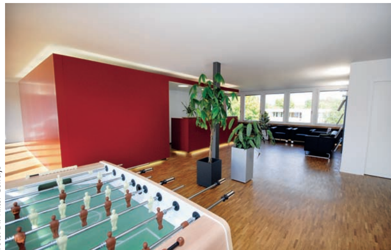
Ein Tischkicker bringt die Patienten vor der Behandlung auf andere Gedanken.