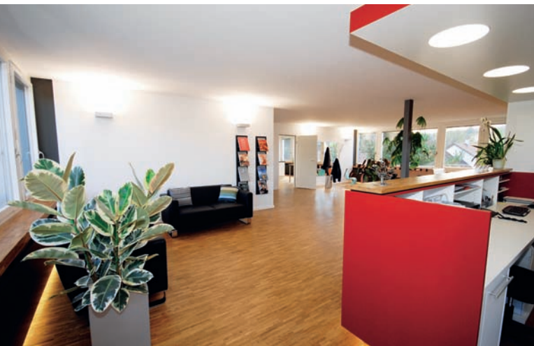
Ein Zentralmodul, das den Empfangsbereich darstellt, bildet den Kern der Praxis.

entspannend präsentieren sich auch die Behandlungsräume der Praxis: Ganz bewusst wurde hier die Behandlungszeile im Rücken der Einheiten platziert, damit die Patienten während der Behandlung die Sicht durch die großen Fensterflächen ins Freie genießen und sich bei Bedarf von den an der Decke installierten Plasma-TV-Bildschirmen ablenken lassen können. Anders als in den übrigen Räumen dominiert hier ein eher kühles Farb- und Materialkonzept. Der CI-Farbtönen Anthrazit der umlaufenden Brüstungsverkleidung wird dabei von den Polstern der Behandlungsstühle wieder aufge-