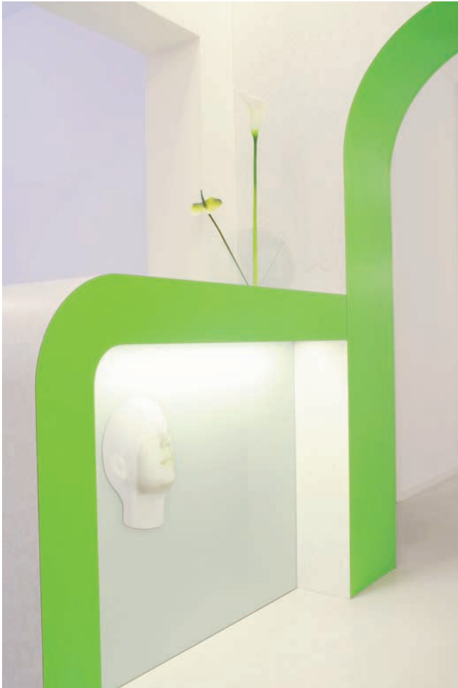
Organische Formen und eine abgestimmte Lichtgestaltung schaffen eine ruhige Atmosphäre.