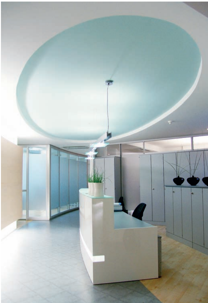
Willkommen im High-Tech-Zeitalter der Praxisgestaltung

Farbtöne Meerblau, das ebenso aus den CI-Farben der Praxis rührt, sowie Silber, das für die moderne High-Tech-Ausstattung steht und das auf der Homepage sowie der Geschäftsausstattung durch ein Logo in Form eines durch Gitterlinie dargestellten Zahnmodells aufgegriffen wird. Um nicht zu kühl zu wirken, wird das Farbkonzept durch helle, behagliche Holzöne und das frische Grün der großen Bilder in den Räumen ergänzt. Als weiteres Element zu Schaffung einer angenehmen Atmosphäre tragen sämtliche Mitarbeiter der Praxis Kleidung in einem angenehmen Rot-Ton. Darüber hinaus setzt Gutwerk ganz gezielt auf den Einsatz von Aromatherapie, um so den unangenehmen Praxisgeruch durch möglichst angenehme Düfte zu ersetzen. Im Eingangsbereich der Praxis dominiert zunächst eine große Glastür, die durch eine