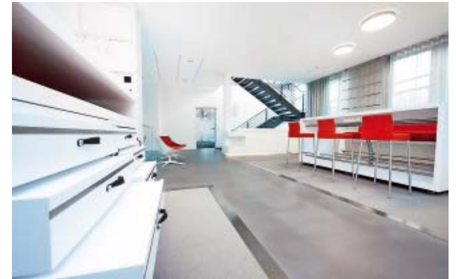
Rollbarer Mustertisch in weiß/aqua mit verschließbaren Setzkästen zur individuellen Bemusterung